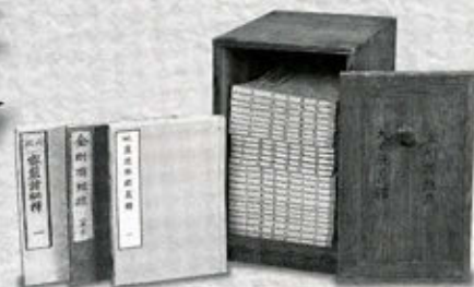
「密教諸秘疏、秘釋」武雄鍋島家より拝領

弘法大師ご開基以来、1210年の時を超えて 受け継がれた宝物の数々。 今回は仏像、宝物、掛軸、書画、古文書など60点を展示。 ぜひこの機会に、仏教文化、密教美術に触れ 親しんでいただければ幸いです。