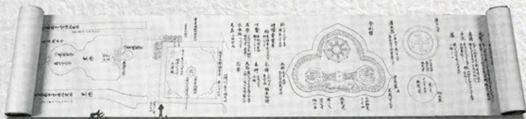
「注進醍醐三宝院併遍智院灌頂道具絵様」